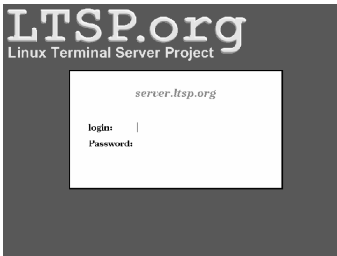
Figur 4–1. Login screen

Etherboot-programmet leses fra diskett og legges i minnet, nettverkskortet blir funnet, DHCP-forespørselen sendes ut på nettverket og et svar returneres fra tjeneren etterfulgt av Linux-kjernen som blir overført fra tjeneren til arbeidsstasjonen. Når kjernen har startet opp komponentene i arbeidsstasjonen vil X starte opp og et innloggingsvindu dukke opp på skjermen. Dette kan se ut som i eksempelet under dersom du benytter XDM: